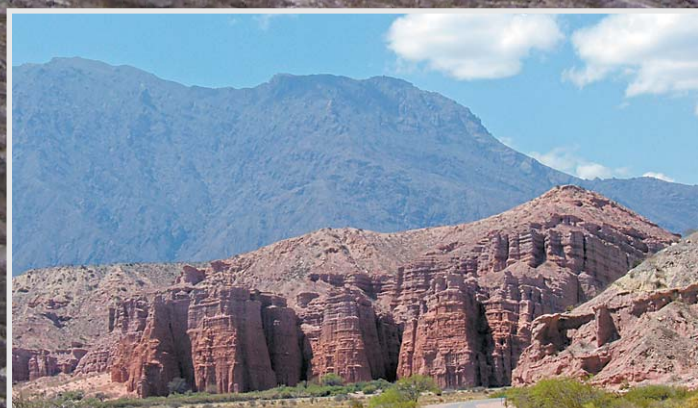
LOS CASTILLOS, una muestra de las formaciones en el Valle Calchaqufes.

Esta provincia, ubicada en el noroeste de Argentina, es conocida por sus paisajes andinos, sus viñedos, su folclor y unas empanadas que se derriten en la boca