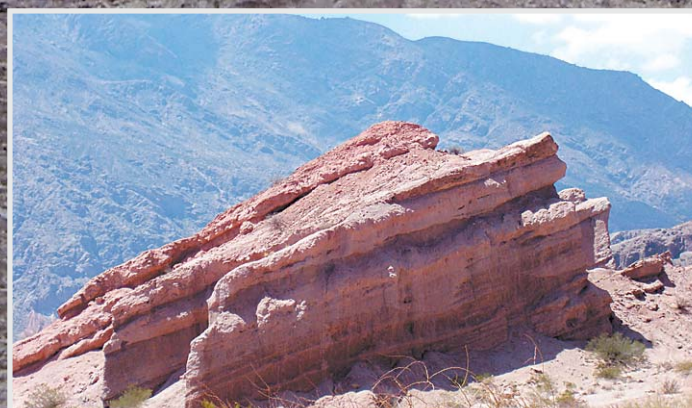
LA QUEBRADA de Cafayate se destaca por sus paisajes coloridos.